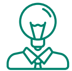
Planejamento de Pessoal